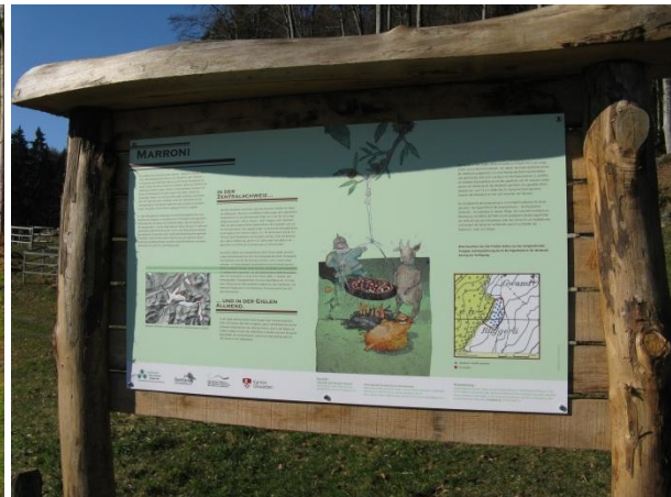
Bilder links: Kastanienhain Giglen Allmend vor (Nov 2008) und nach (Jan 2012) der Haineinrichtung. Bilder rechts: Hain und Haininfotafel.